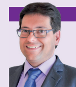
PUNTO DE VISTA

Pero, como ya estamos cerrando el artículo, no quiero despedirme