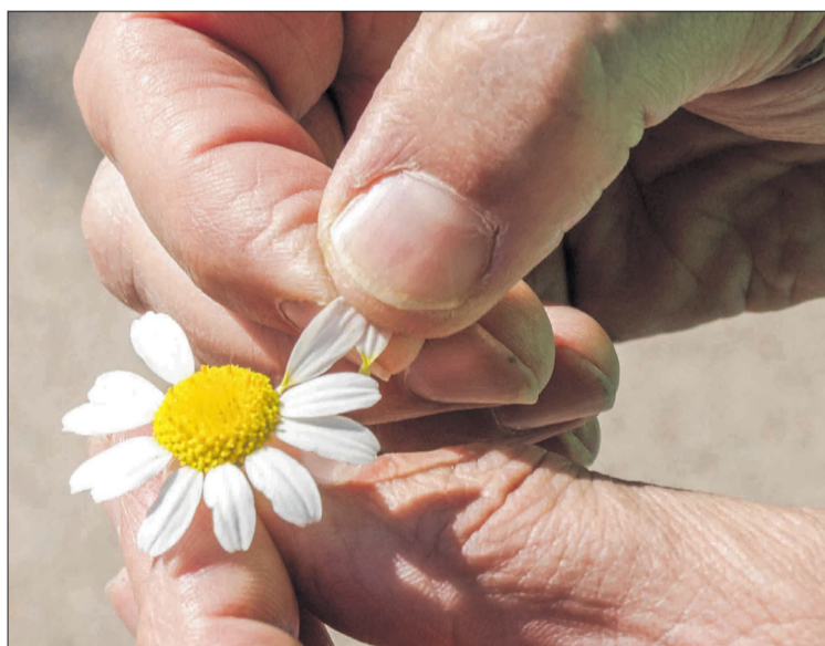
“Me quiere... No me quiere”.

de algunas plantas posibilitaba la construcción de algunos tipos de barcos . En Riba de Saelices se construían pequeños barquitos con la hoja del carrizo ( Phragmites australis ); a base de sencillos