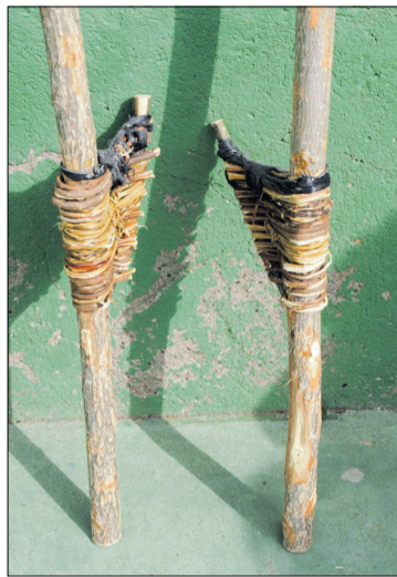
Zancos. Pálmaces de Jadraque.

El clima y los agentes atmosféricos condicionaban la existencia de determinados juegos, juguetes y pasatiempos; el invierno era propicio para los juegos en el interior de las casas: juegos de naipes y de mesa, de dedos y manos, de adivinanzas, trabalenguas y otros muchos en los que las palabras eran protagonistas; era el tiempo de las largas veladas alrededor de la lumbre en las que los mayores se entretenían recordando las viejas leyendas y contando cuentos a los niños, mientras estos practicaban juegos de cuerdas con las manos. La nieve, en aquellos tiempos de grandes nevadas de montaña, aseguraba la diversión con peleas a bolazos, fabricación de muñecos y pistas de patinaje improvisadas. Cuando llegaba la