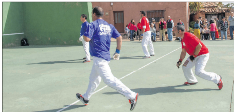
Partida de frontón.