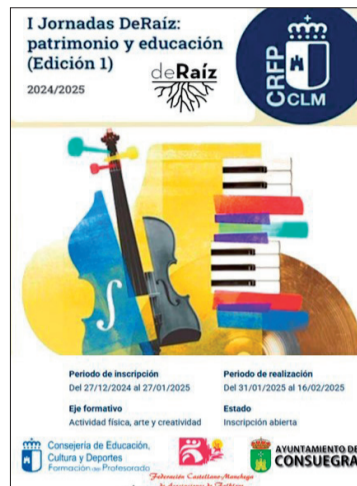
Cartel de las 'I Jornadas DeRaíz.'