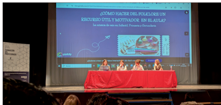
Un momento de las Jornadas.

Todo esto visto de forma esquemática, para entendernos entre nosotros, vamos; porque la verdad es que la escuela, el mundo de la enseñanza reglada, nunca estuvo ajeno a la cultura popular. De hecho muchas canciones, juegos y tradiciones viajaban en las maletas de los maestros y maestras y acababan asentándose en las nuevas escuelas donde eran destinados. Muchos romances, retahílas, juegos, etc. eran transmitidos en las aulas, algunos de ellos directamente aprendidos de los antiguos cancioneros impresos.